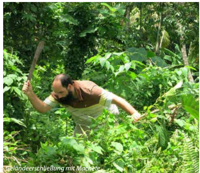
Geländeerschließung mit Machete