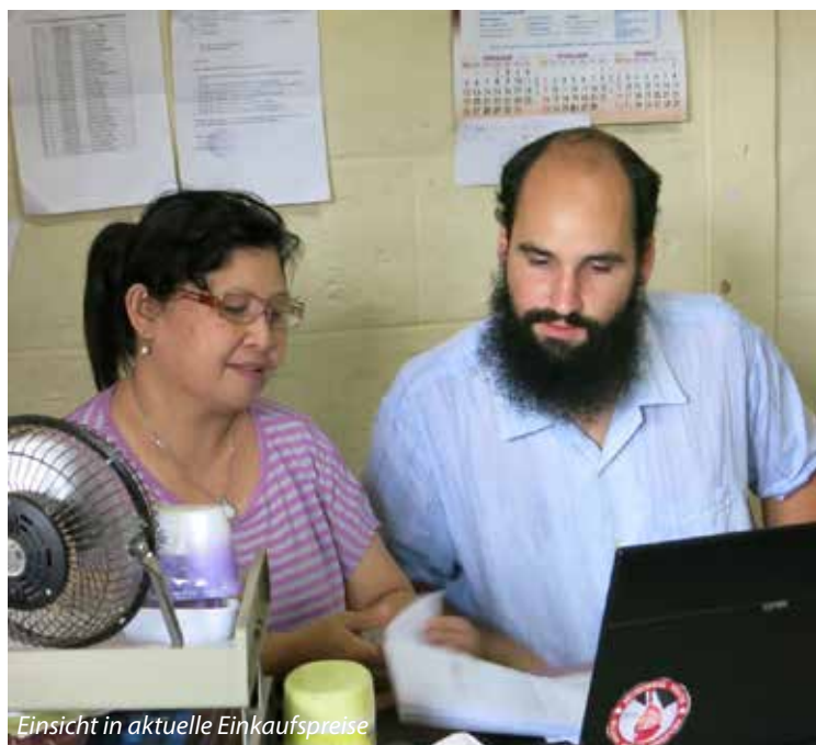
Einsicht in aktuelle Einkaufspreise

Wie bereits erwähnt, ist eine meiner Hauptaufgaben, die Finanzen und Buchhaltung in die Hände zu nehmen. Leider konnte ich in diesem Bereich bisher nicht allzu viel machen, da ich diese Geschäfte erst dann von unserer Bürokratie übernehmen kann, wenn ich hoffentlich bald das sog. KITAS-Visa (= Arbeitsvisum) in Händen halten werde.