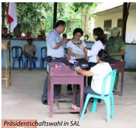
Präsidentenwahl in SAL

gen, dass diese Wahl wie keine zuvor sehr stark durch Sozialmedien geprägt ist. Da das Medium Internet und der richtige Umgang damit in Indonesien noch recht jung sind, wird Information häufig ungefiltert aufgenommen, was, insbesondere für eine Wahl wie diese, weitreichende Konsequenzen hat. Auch wenn beide Kandidaten Muslime sind, scheint es für die Menschen hier sehr wichtig zu sein, ob ihre Verwandten oder Vorfahren christlich sind oder nicht. Da Jokowi Gouverneur von Jakarta und sein Vize Christ und Chinese ist, könnte es in Jakarta starke Veränderungen geben, da beides eine Minderheit in Indonesien ist.