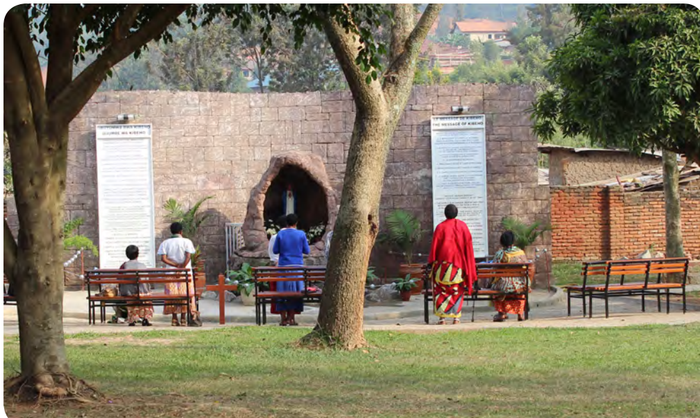
Mariagrot op het terrein van CECYDAR

De plaats wordt ook wel 'het dal van de vrede' genoemd. De hele dag door zie je er mensen in gebed, buiten bij Maria, of in aanbidding in de kapel. Elke dag komen er ook velen naar de Eucharistieviering. Het kan niet anders dan dat dit gebed ook vrucht draagt voor de kinderen. Als ik terugdenk aan de kinderen en weer naar de foto's van hen kijk, is het vooral hun vreugde die me raakt. CECYDAR is een plek, waar de kinderen hun zorgen en ellende even kunnen vergeten, gewoon weer kind kunnen zijn en kunnen spelen en genieten van het leven. Laten we hopen, dat ze met alle steun en gebed hun weg in het leven mogen vinden en mogen uitgroeien tot evenwichtige volwassenen.