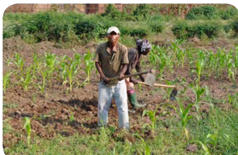
Mensen op het land aan het werk

Het landbouwproject levert gezonde voeding voor de kinderen. Ook is er nog steeds een hoge productie van eieren, die verkocht worden aan diverse klanten. Men wil graag de opbrengst verhogen en is net overgestapt op een nieuw systeem van het betalen van de