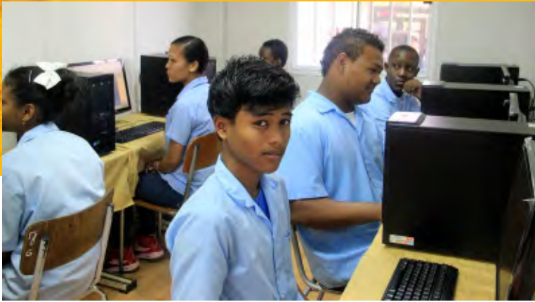
Een onderdeel van het lesprogramma is het volgen van computeronderwijs