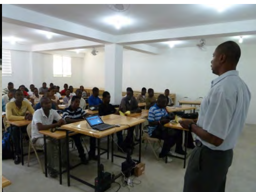
Docent aan het werk