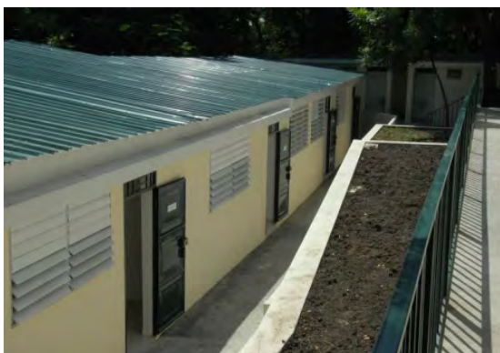
Zicht op de verschillende klaslokalen