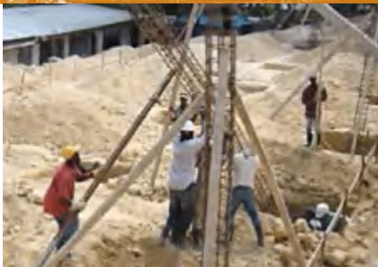
Aanbouw van de school