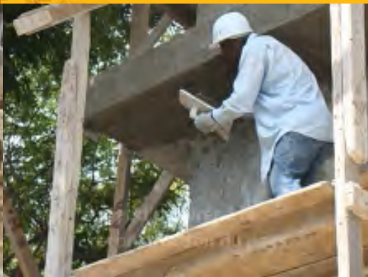
Metselen van een klaslokaal