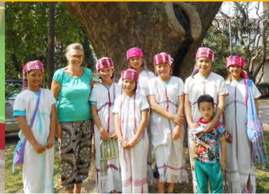
Karen-meisjes in witte jurk