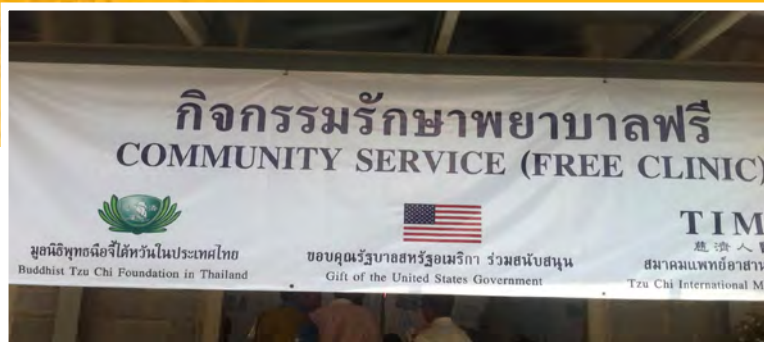
De TzuChi Clinique

nog een lange moeilijke weg moeten gaan alvorens dit gerealiseerd kan worden. Als maatschappelijk werkster probeer ik met hen de ideeën uit te werken en te kijken hoe ze er nu al aan zouden kunnen werken, ook al zijn de omstandigheden erg moeilijk.