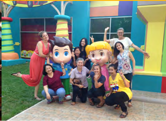
Dagje uit met het team van URP