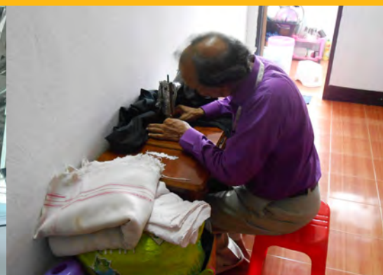
Vluchteling werkt als couturier

Het was een groot succes en gelukkig geen inval van de politie.