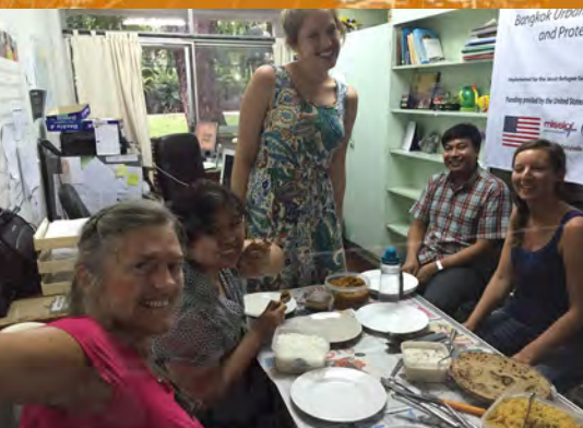
Maaltijd met collega's