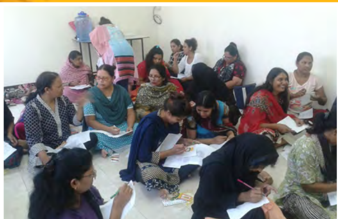
Pakistaanse vrouwen leren borduren