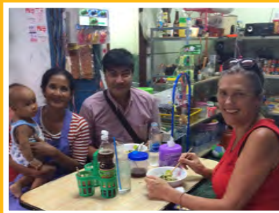
Woonruimte zoeken voor gezin

derzoek doen alvorens ze te erkennen als minderjarigen. Plotseling wordt URP geconfronteerd met deze groep die helemaal niet voorbereid is op een zelfstandig leven en dus aanklopt voor hulp. Zij verwachten op dezelfde manier geholpen te worden als bij BCP. Helaas URP gaat uit van eigen verantwoordelijkheid en net als met de andere klanten worden ze op weg geholpen en daarna moeten ze het zelf doen. Vaak zijn ze nog zo onvolwassen, hebben geen enkele structuur in hun leven en hangen maar wat rond. Ze gaan niet naar school, leren geen Engels en hebben amper een idee over hun leven. Deze groep is moeilijk te benaderen. Het is triest maar we hebben geen mogelijkheden om ze verder te helpen.