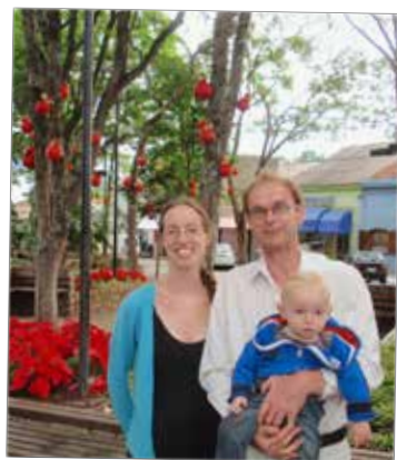
KERST IN SAO PAULO