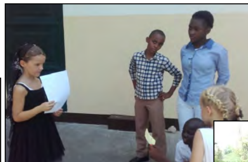
H. Thérèse van Lisieux