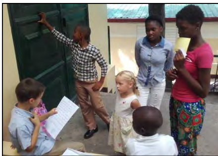
Sint-Vincentius a Paulo

Gelukkig, dankzij de Emmanuel Gemeenschap, houden wij de juiste richting! De gemeenschapsleden zijn echte broeders en zusters en het is verrassend vast te stellen dat het de enige Haïtianen zijn met wie wij er in slagen de ongelijkheden en misverstanden te overbruggen ... omdat wij ons rond het voornaamste vinden : Christus.