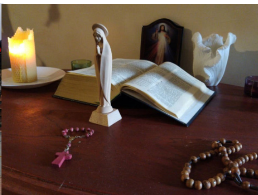
Ons gebedshoekje thuis