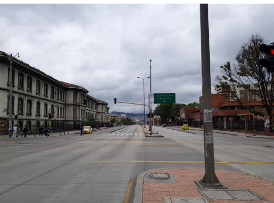
Lege straten in Bogotá door COVID-19