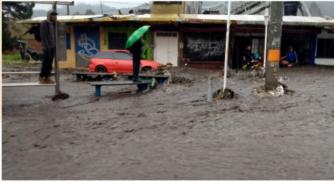
Overstromingen in San Luis