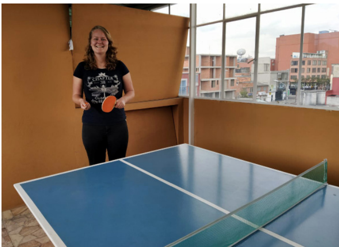
Tafeltennissen op het terras van ons gebouw