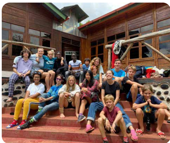
Onze kinderen en hun link brothers/sisters