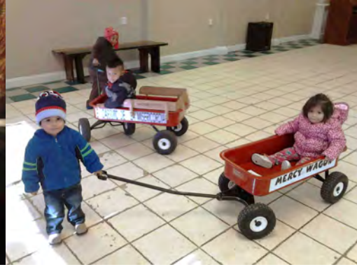
Kinderen spelen in de voedselbank