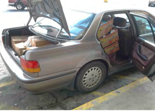
Een auto vol kerstgeschenken