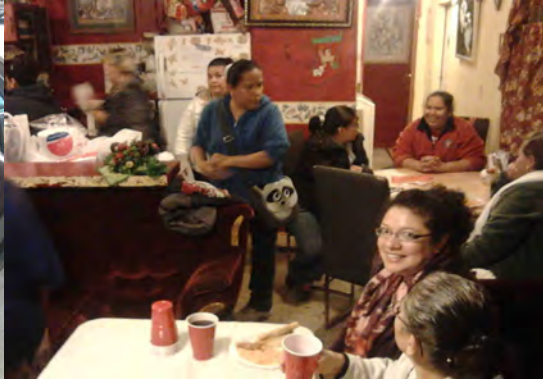
Gezellig samenzijn na de rozenkrans