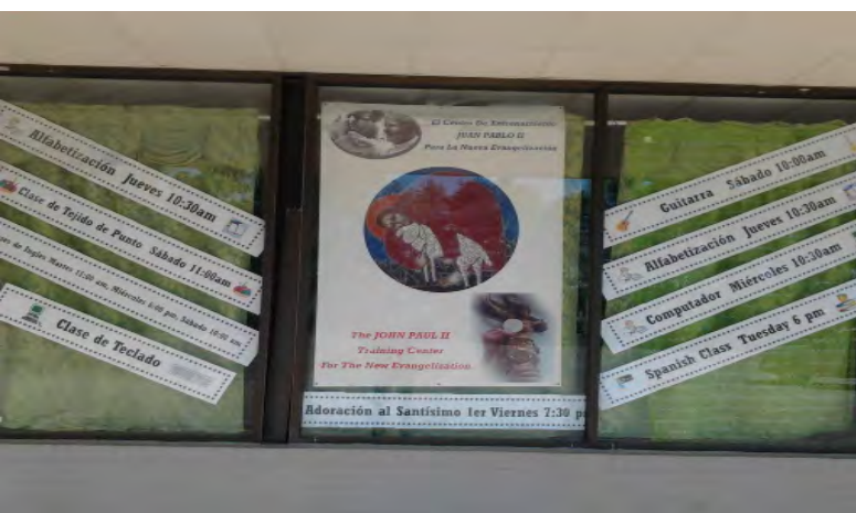
Een aankondiging van alle schoolklassen