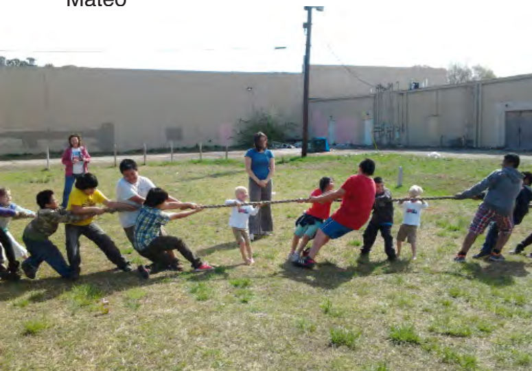
Trouwtrekken op de special Olympics