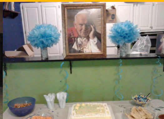
Feest ter ere van de heilige JP11

zo veel mensen aanwezig, maar het was toch goed geslaagd.