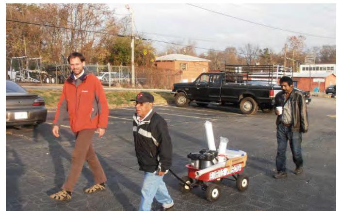
Met koffie op weg naar de esquina