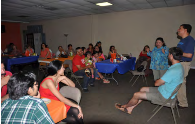
Speech bij mijn afscheid in Gainesville