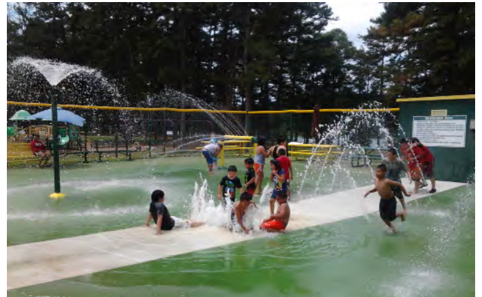
Jaarlijks uitje naar het Laurel park (2014)