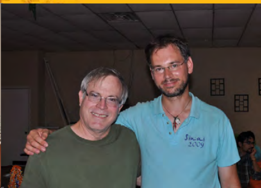
Afscheid van Charlie