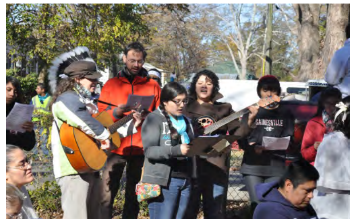
Met z'n allen zingen