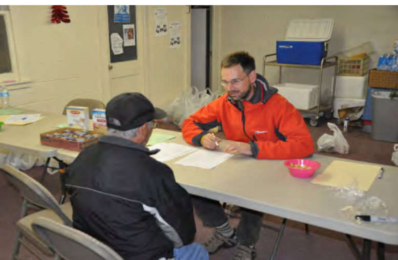
Aan het werk bij de voedselbank