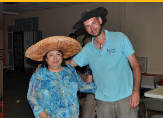
Afscheid van Vicky