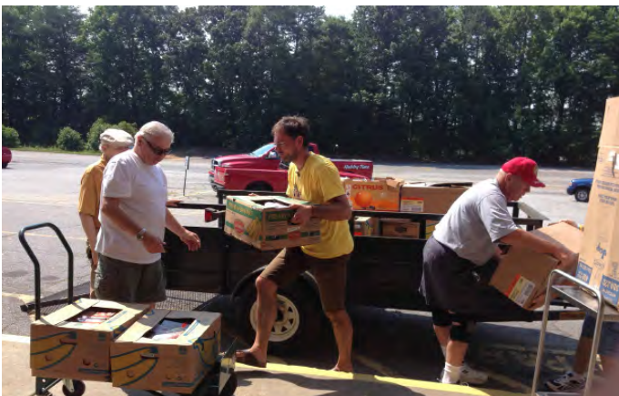
Het uitladen van voedsel voor de voedselbank