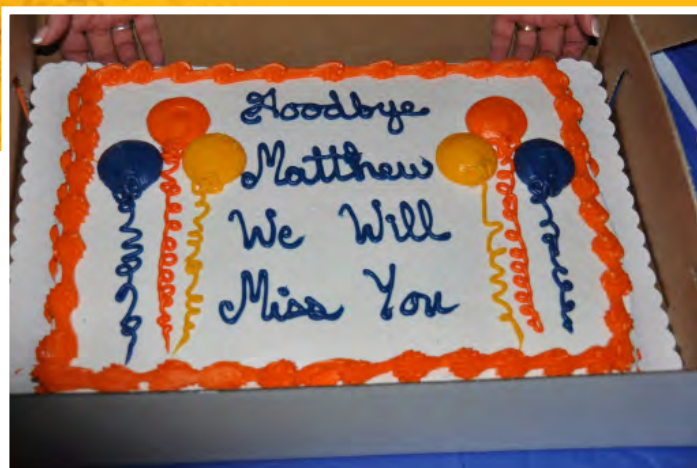
Taart bij het afscheid

met (oranje) bloemen door het Fidesco-team op Schiphol opgewacht. Door de vermoeidheid vergat ik daar nog bijna mijn hoed.