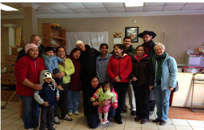
Vrijwilligers van de voedselbank