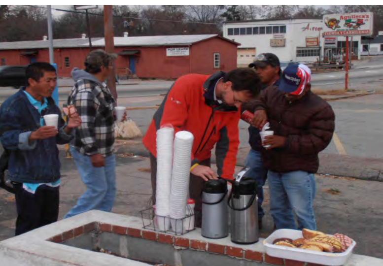
Aan het werk op de esquina