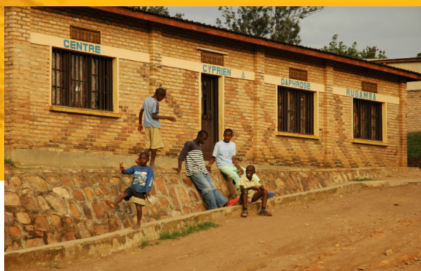
Voormalige straatkinderen voor het Center Cyprien en Daphrose Rugamba in Kigali, Rwanda