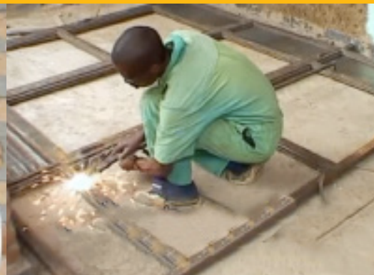
Afgestudeerde leerling is nu lasser