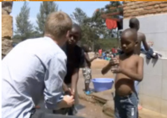
Les in hygiëne