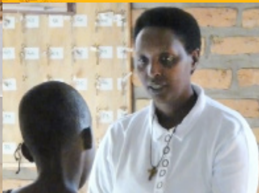
Gesprek met de psychologe