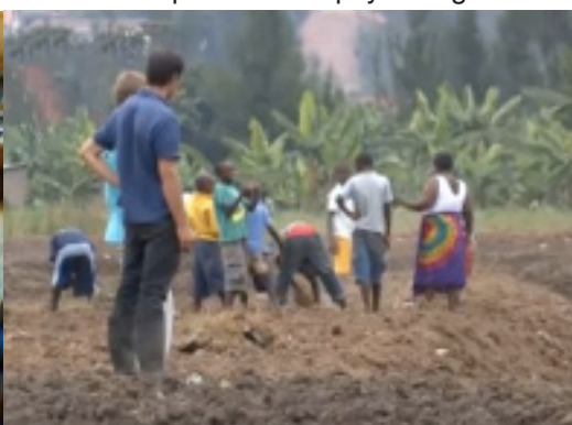
Agrarisch veld bewerken