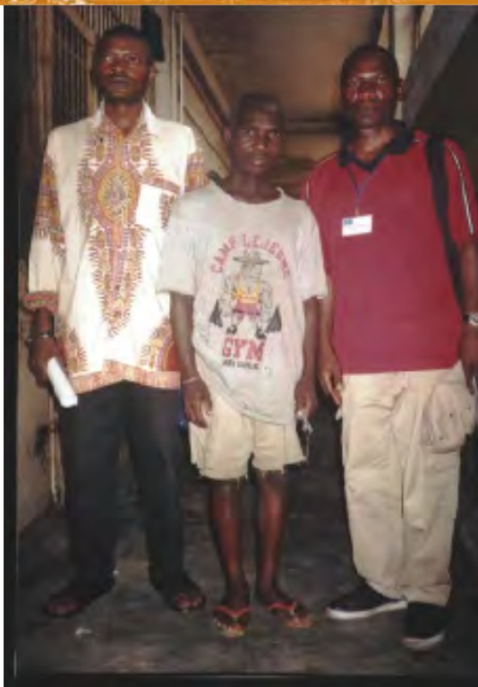
De gevangenen wachten op uw hulp