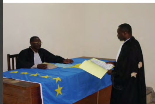
Advocaten pleiten bij de rechter in DR Congo