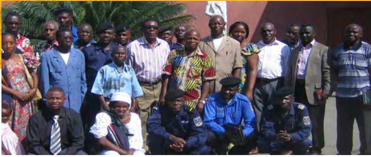
Vrijwilligers bezoeken de gevangenen eenmaal per week

dienst uit. Wie zijn barak wil verlaten, wordt door mannen met knuppels weer naar binnen geslagen. De meeste gevangenen komen jarenlang niet buiten.