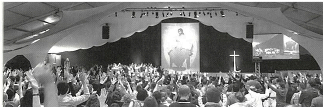
Gemeenschap Emmanuel in Paray-le-Monial.

Gemeenschap Emmanuel nog beter leerde kennen. Mede daardoor ben ik in 2005 zelf lid geworden. Vervolgens heb ik zes jaar natuurkundig onderzoek gedaan in Duitsland, eerst in Düsseldorf en daarna in het Harzgebirge. Ook daar is met hulp van de Gemeenschap Emmanuel mijn geloof verder gegroeid.