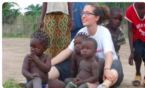
'Missie kan echt hun levensgeluk vergroten.'

zien de armen dan dat wij ons niet om hen bekommeren vanwege ons zelf maar dat het ons om hen gaat, dat we hen naar een hoger niveau willen tillen. Missie kan echt hun levensgeluk vergroten. Op spiritueel, sociaal, intellectueel, emotioneel en fysiek vlak. Geweldig toch!?' aldus De Jong.