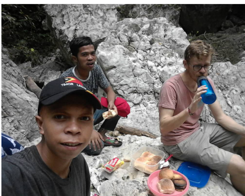
Eten delen tijdens een excursie

Toen ik terug was in Nederland kon ik, ondanks de teleurstelling van mijn voortijdige en vluchtige vertrek, ook terugkijken op wat we hadden bereikt in de anderhalf jaar dat ik in Baucau was. Ik had meegeholpen om een school verder op te bouwen, die in 2017 met 100 dollar was begonnen door de plaatselijke pastoor. Ik heb nieuwe gebouwen zien verrijzen, zoals de bibliotheek, de kantine en een kantoorruimte. Ik heb gezien hoe nieuwe leraren de gaten in het lesrooster opvulden en hoe er een steeds consistentere lesprogramma ontstond. Ik heb zelf mogen bijdragen