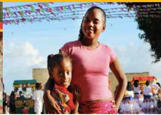
Een studente met haar kind