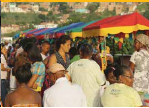
Het gekookte eten wordt verkocht