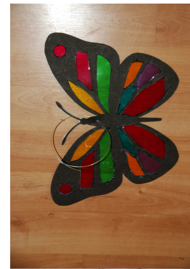
9. Maak een touwtje vast aan de Heilige Geest duif en/of vlinder.