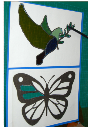
4. Werk alle witte snijresten bij met een zwarte viltstift.