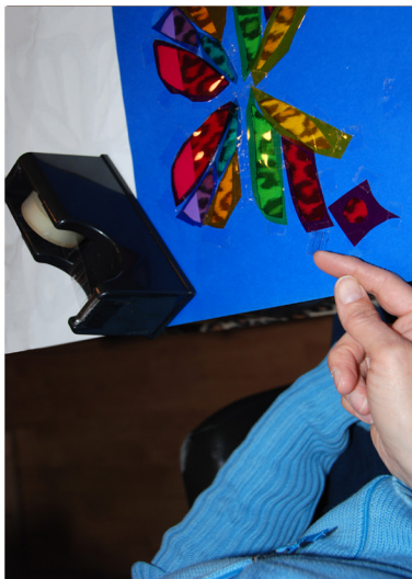
6. Doe dit tot alle witte vlakken beplakt zijn. Gebruik verschillende kleuren voor effect.