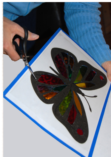
7. Knip de Heilige Geest duif en/of vlinder uit.