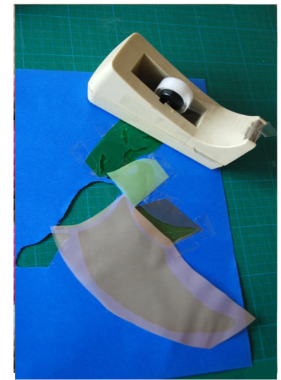
5. Plak aan de achterkant vliegerpapier of glas-in-lood papier vast met plakband.