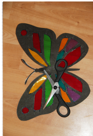
8. Maak een gaatje in de Heilige Geest duif en/of vlinder.