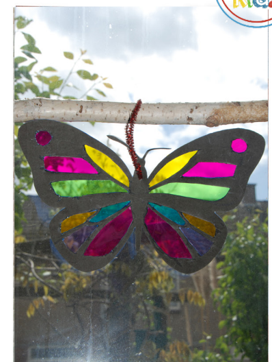
10. Hang de Heilige Geest duif en/of vlinder voor het raam op.