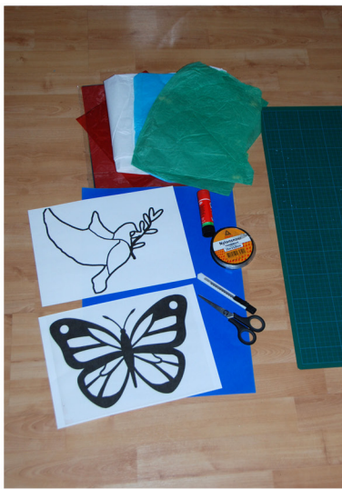
1. Leg alle materialen klaar.