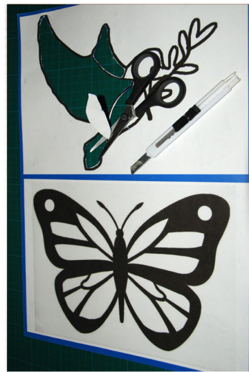
3. Snijd/knip de witte vlakken uit de Heilige Geest duif en/of vlinder.