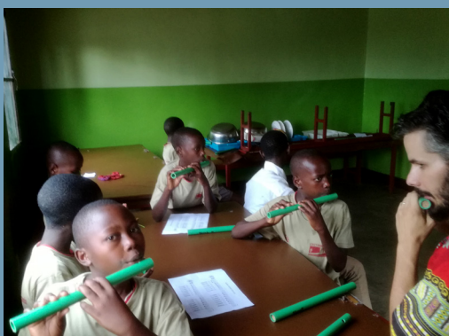
Fluiten maken met leerlingen