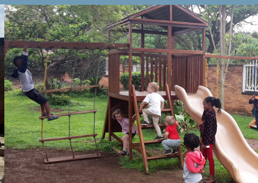
Onze kinderen gingen naar school