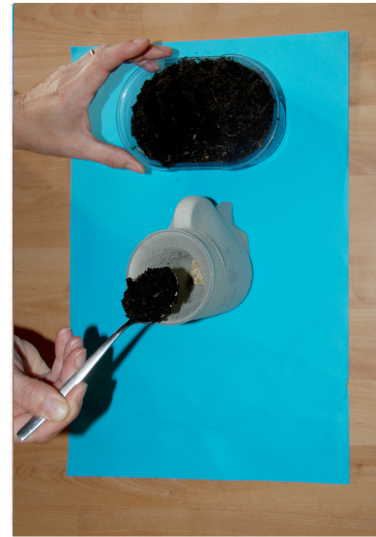
4. Voeg aarde toe.