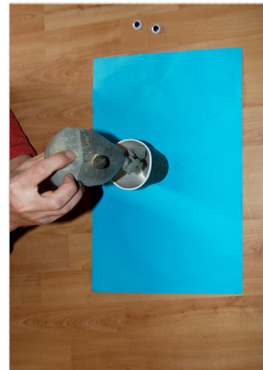
9. Knoop de pantykous dicht en zet hem in een papieren beker.