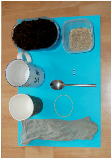
1. Leg alle materialen klaar.