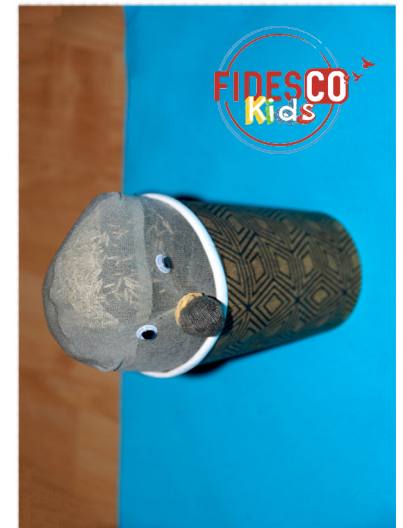
10. Geef jouw graspoppetje (wiebel)ogen en dagelijks wat water. Houd geduld!