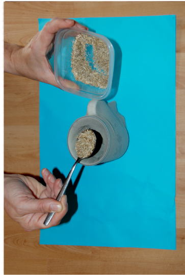
3. Doe graszaad in de pantykous.