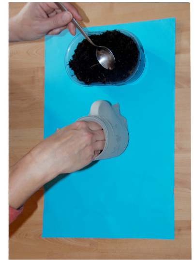
5. Druk de aarde tussendoor steeds goed aan.