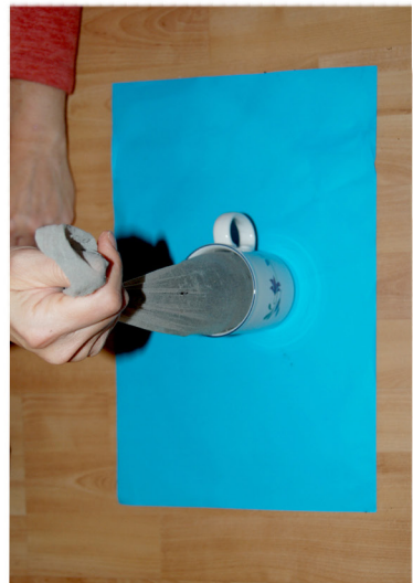
7. Haal de pantykous uit de beker.