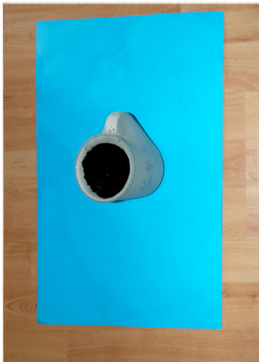
6. Vul de beker vol met aarde. Druk tussendoor steeds goed aan.