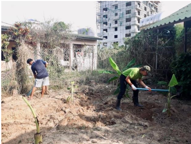
Préparer le sol pour les cacahuètes avec Br. Ieth

Avec le covid, tout le monde a déjà fait l'expérience d'un confinement.. alors ce que je vais vous raconter ici n'est probablement pas nouveau mais nécessaire pour vous partager ma vie au Cambodge. Avec la fermeture de l'école et le départ de la plupart des pensionnaires - laissant un petit groupe de 6 filles et 4 garçons - il était temps de me réinventer et de réinventer ma mission . Ma mission d'enseignante s'est transformée en une présence virtuelle avec un nouveau défi : comment garder les élèves (et moi-même) motivés ? Ma mission à l'hôtel - qui est également fermé en raison du lockdown - avait besoin d'une « mise à jour ». En y repensant maintenant, je me demande si la partie la plus difficile d'un tel confinement n'est pas la confrontation avec nous-mêmes. Si on ne peut pas sortir, si on ne peut pas se détendre au sens classique du terme, on est alors coincé avec soi-même et toutes nos pensées. Mais l'ennui est un excellent terrain pour la créativité . J'ai donc commencé à chercher de nouveaux défis et de nouvelles activités.