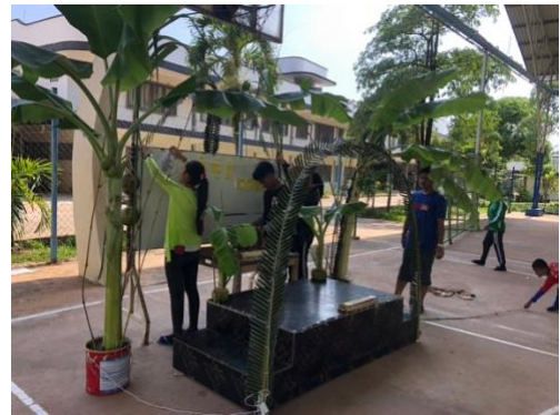
Quelques pensionnaires en faisant les decorations

Le Nouvel An khmer était une célébration spéciale de 3 jours. Les élèves ont fabriqué un magnifique sanctuaire pour accueillir l'ange qui protégera le Cambodge cette année. Ils ont brûlé de l'encens et offert beaucoup de fruits et de boissons. C'était magnifique de voir comment ils ont fait toutes les décorations eux-mêmes. Les gens d'ici me surprennent tous les jours par l'étendue de leurs connaissances : ils peuvent fabriquer presque tout, ils ont beaucoup de compétences pratiques. L'après-midi, nous avons joué des jeux avec les étudiants et les enfants et, les deuxième et troisième jours, il y avait une grande bataille d'eau.