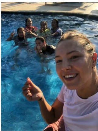
Cours de natation avec les filles

C'est en partie grâce à brother Martin que j'en suis venue à voir les choses de cette façon. Une fois quand j'ai exprimé mon soupire sur les nombreux absents pendant le cours en ligne, il m'a répondu que même si à la fin de ma mission il n'y a qu'une seule personne ici qui parle un peu mieux l'anglais qu'au début, alors c'est un succès. Si il y a eu au moins une personne qui a été touché par ma présence ou motivé par mes cours alors ma mission est réussie .