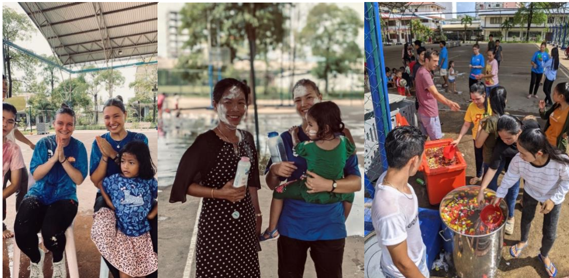
Quelques images de Khmer New Year